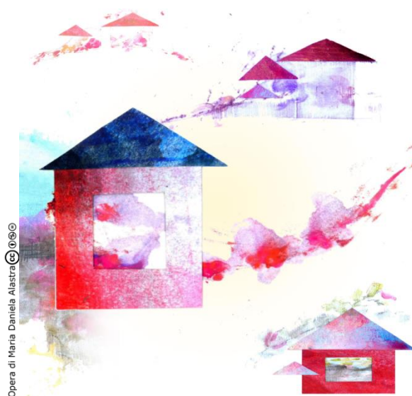
Opera di Maria Daniela Alastra © 2020